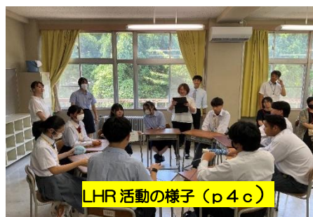
LHR 活動の様子 (p4c)