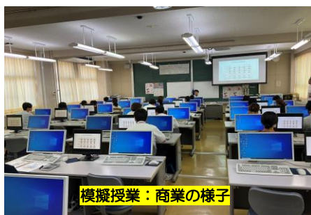
模擬授業：商業の様子