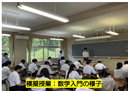
模擬授業：数学入門の様子